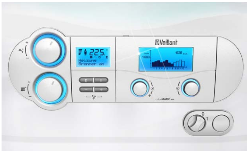
Bild 1: Designentwurf mit beleuchteten Bedienelementen

Für die Designumsetzung eines neuen Bedienkonzeptes beabsichtigte die Firma Vaillant, Lichtelemente in den Bedienbereich ihrer Geräte zu integrieren.