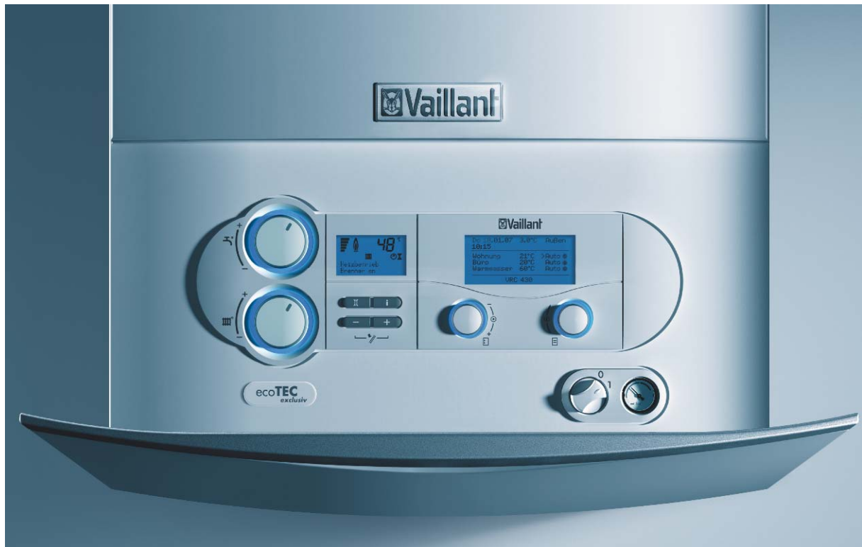
Bild 3: Das Wandheizgerät ecoTEC exclusiv mit neuem Bedienkonzept

Das Ergebnis der erfolgreichen Zusammenarbeit zwischen der Firma Vaillant und unserer Ingenieurgesellschaft M.TEC kann sich sehen lassen: